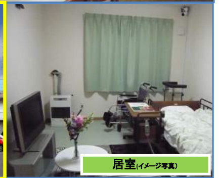
居室(イメージ写真)